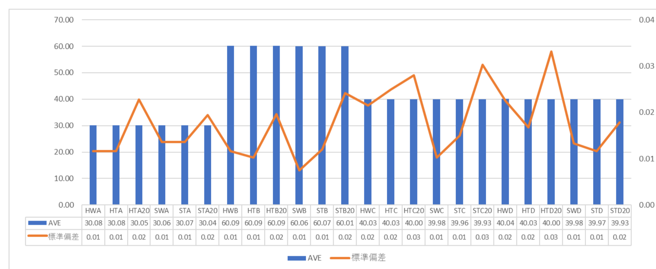
(表1) 各模型A～Dの距離平均値と標準偏差

A～D各距離の計測結果を(表1)に示す。硬質石膏ではHW<HT<HT20の順で精度に微量のばらつきが見られ、超硬質石膏ではSW<ST<ST20の順で精度に微量のばらつきが見られた。A～Dの距離平均値に有意差は認められなかった(p<0.05)。CADソフトによるマッチング結果でも上記と同等の誤差をカラーチャートにて確認する事が出来た。